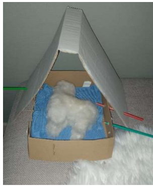
Figuur 4. Tent voor knuffel

Voor de kinderen die werden geplaatst in jeugdinstituten verloopt het transitieproces des te moeilijker. De veiligheid en geborgenheid die de (pleeg)families bieden, kan in de instituten niet worden gegarandeerd. Geregeld waren er discussies tussen de moeders en de instituten over een gebrek aan hygiëne en verzorging: ongekamde haren, ongewassen handen, ongeknipte nagels, ongewassen kleren en onbehandelde wonden. Bij drie van de acht kinderen die werden geplaatst in jeugdinstituten zijn er aanwijzingen en vaststellingen van seksueel grensoverschrijdend gedrag. In twee gevallen werd er klacht ingediend bij politie en parket. Hierop kwam geen respons. De confrontatie met het grensoverschrijdend gedrag haalde een van de moeders psychologisch onderuit, ook omdat ze de kans niet kreeg haar kinderen op dat moment op te vangen. Niet enkel omwille van de veiligheid is het belangrijk dat de kinderen terecht kunnen bij familie, maar ook omdat ze kunnen verblijven bij gekende en vertrouwde personen, die het best geplaatst zijn om de onthechting en ontworteling op te vangen en hun transitieproces naar een nieuwe, betrouwbare thuis te vergemakkelijken.